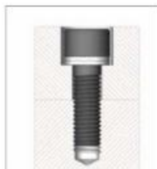
Tornillo cilíndrico asegurado en un agujero ciego