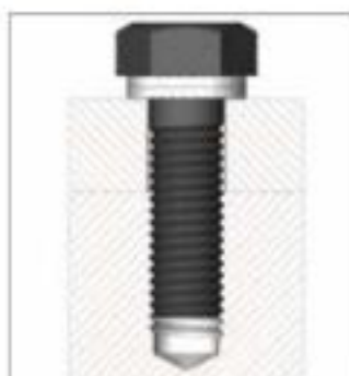
Tornillo hexagonal asegurado en un agujero ciego