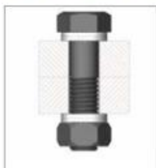
Tornillo hexagonal pasante asegurado a ambos lados