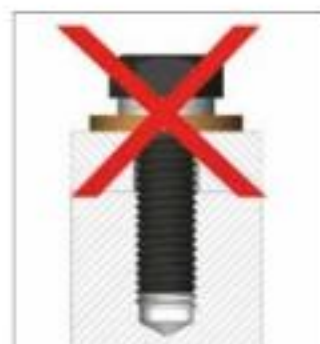
Sin función de seguridad en combinación con arandelas que giran libremente